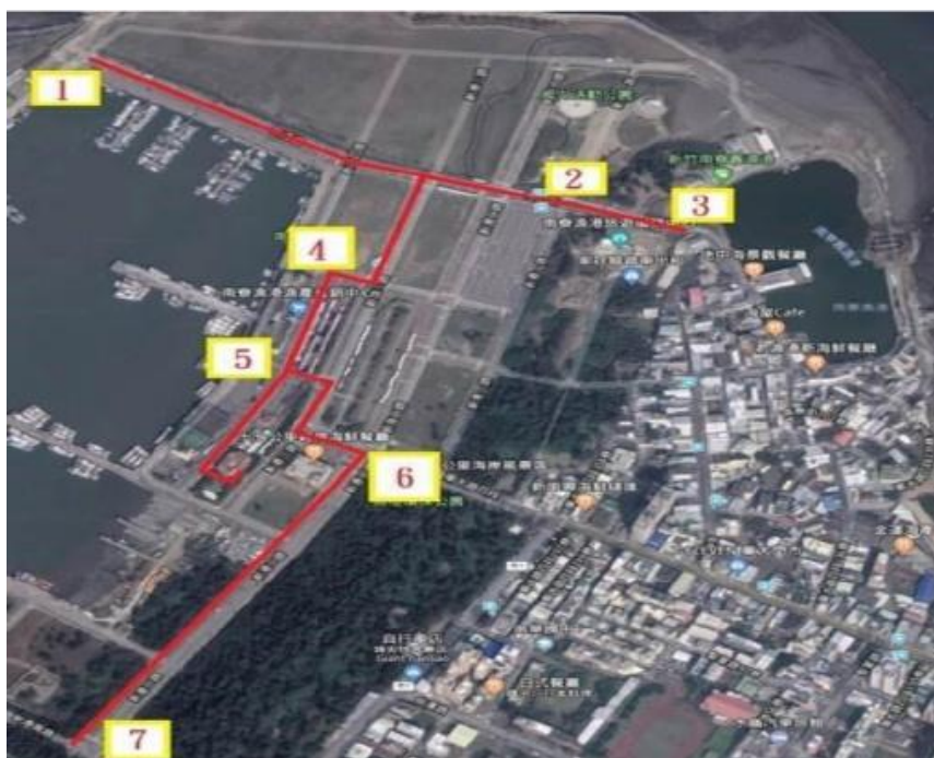
圖 1 南寮漁港「5G 智慧路燈建置計畫」路燈位置示意圖

除智慧路燈外之其他設置區域，廠商可自行選定，但需與本府討論並提出選擇原因，經本府核可後再行設置，其他建議設置範圍亦鎖定於南寮漁港區域內(詳如圖 2)。