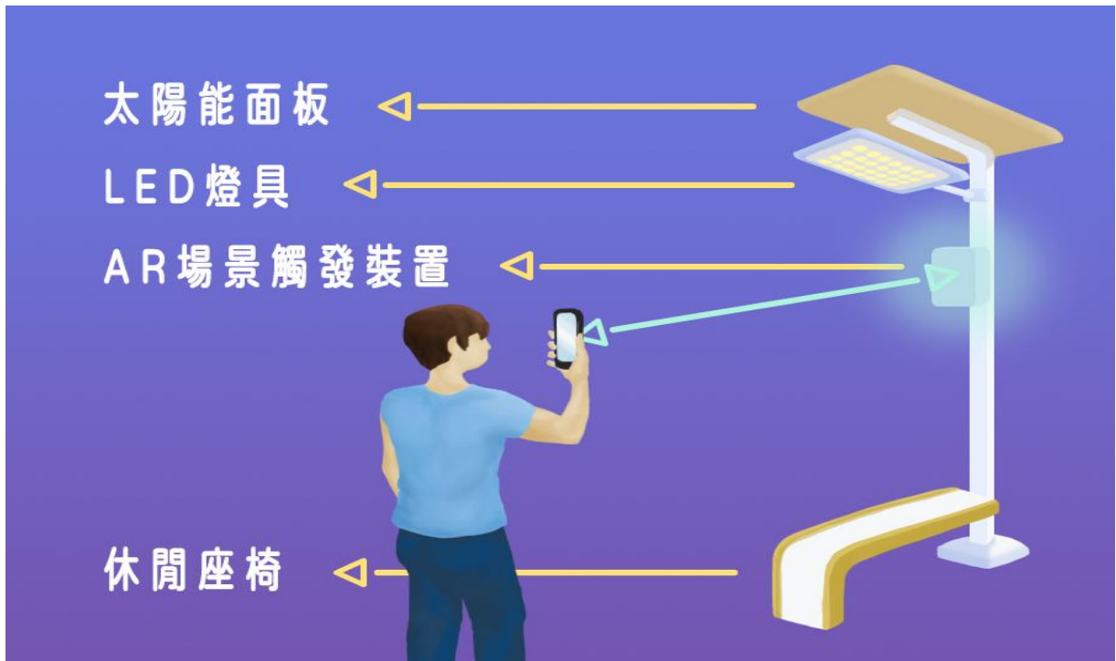
圖1：「綠能智慧 LED 造型路燈」示意圖