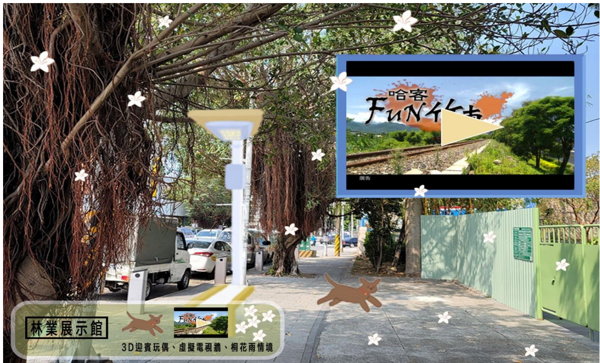
圖3：林業展示館 AR 示意圖