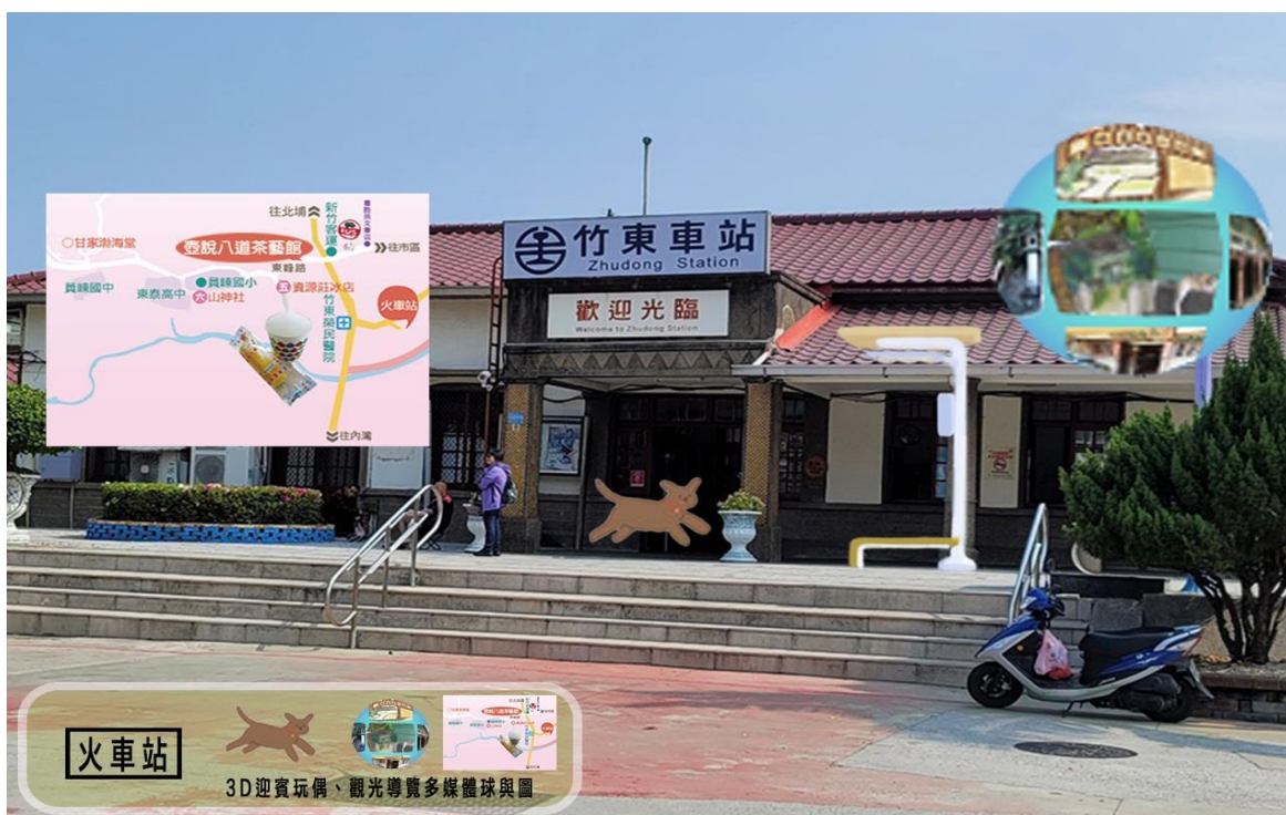
圖2：竹東火車站 AR 示意圖

而且未來這些設備所打造的觀光元宇宙平台要永續營運，公部門可以委託給商圈協會等團體管理營運，管理單位以收費方式開放給商家投放資訊做廣告，就可以是這個平台獲利的商業模式，不但公部門不必持續投入經費節省了公帑，地方觀光商圈也可以按照自己的需求來持續更新遊客感興趣的資訊，更新作業只要透過後台抽換展示資訊即可，成本低廉又便利。