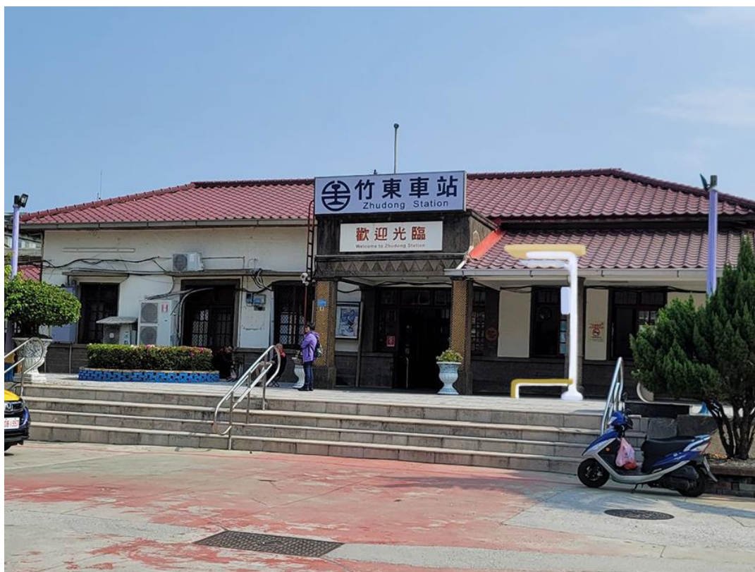
圖7：「綠能智慧 LED 造型路燈」竹東火車站落點模擬圖