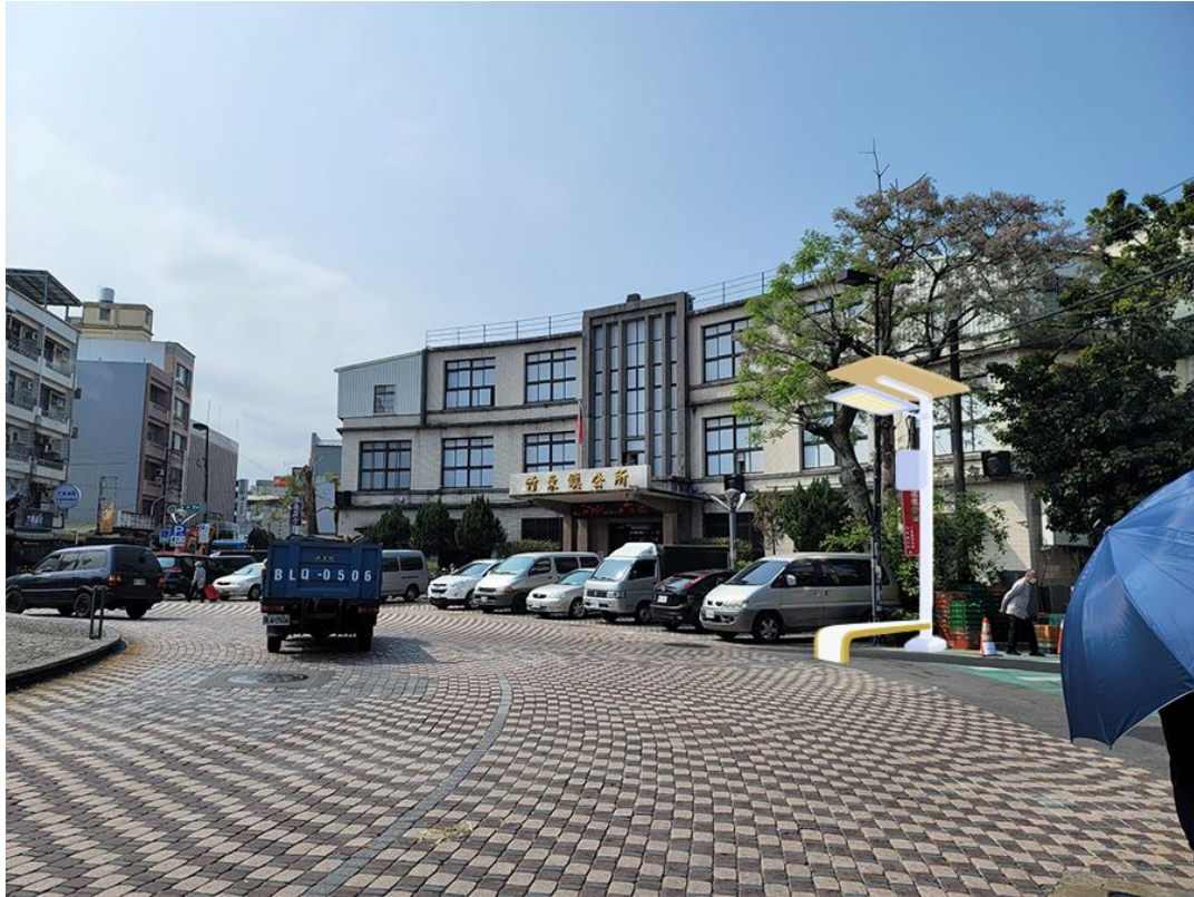
圖9：「綠能智慧 LED 造型路燈」竹東鎮公所落點模擬圖