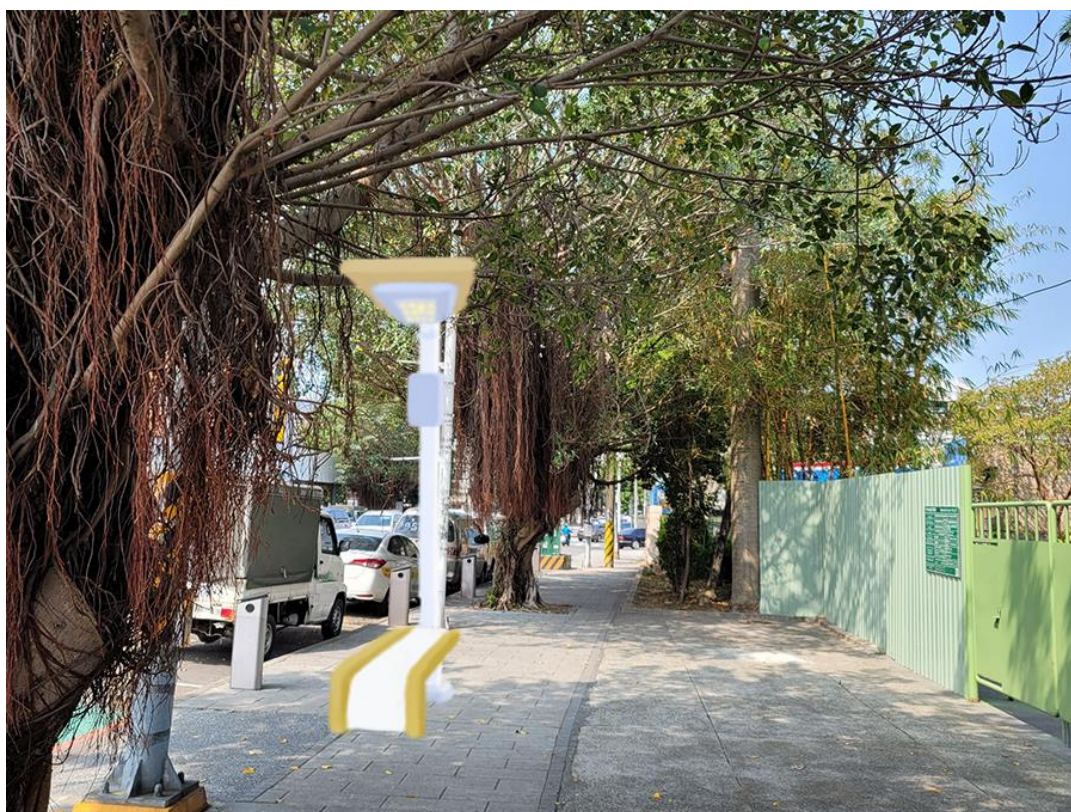
圖8：「綠能智慧 LED 造型路燈」林業展示館落點模擬圖